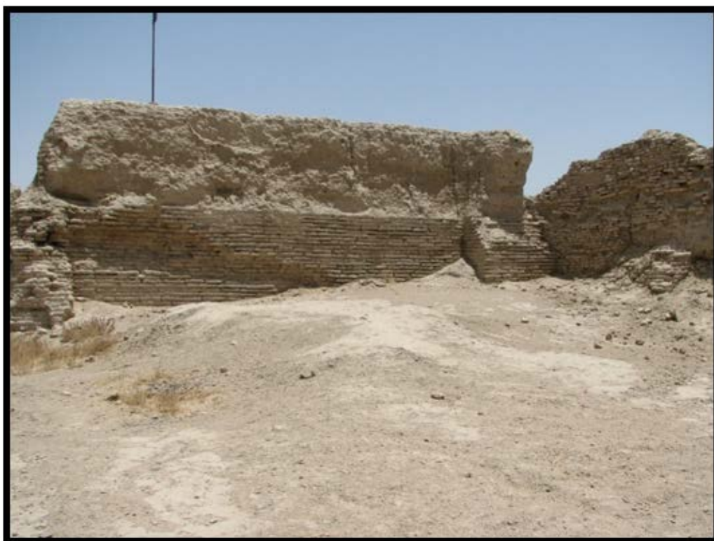
تصویر ۳. بقایای آتشگاه کرکوی.