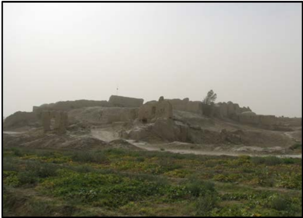
تصویر ۲. نمایی از تپه کرکوی.