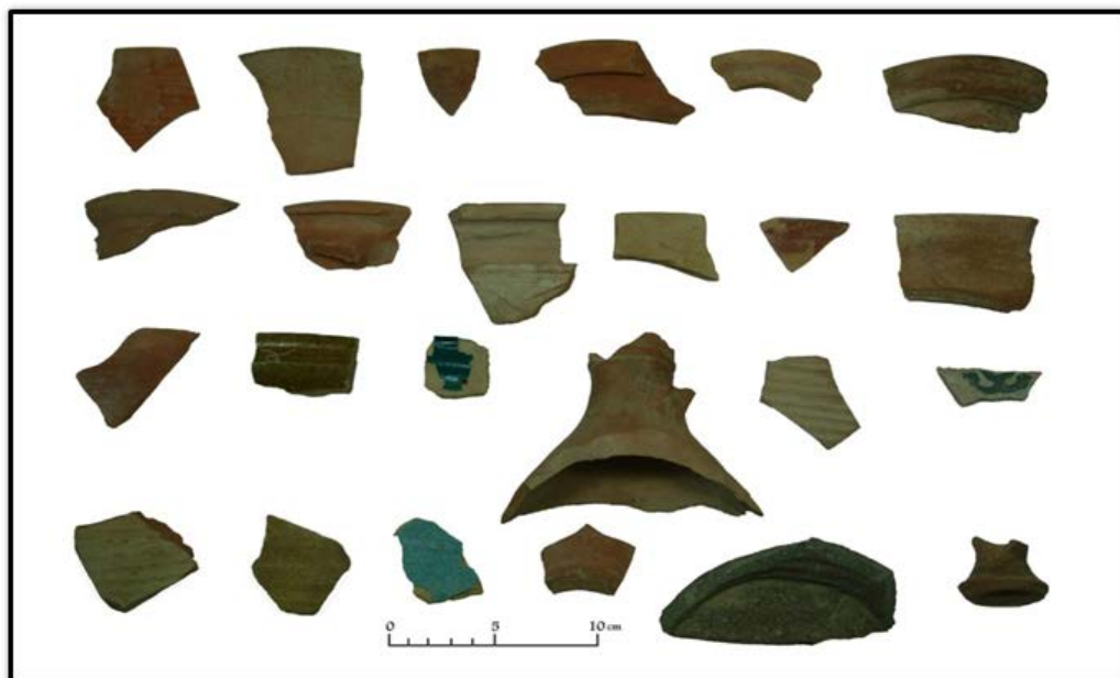
تصویر ۴. سفال‌های شاخص جمع‌آوری شده از سطح تپه کرکوی (نگارندگان).

در سمت شمال تپه، سلسله‌ای از تپه‌های کوچک دیده می‌شود که ویرانه‌های ساختمان‌های بزرگی هستند. در سمت شرق و غرب تپه نیز ویرانه‌هایی دیده می‌شود (تیت، ۱۳۶۲: ۵۳-۵۲). این تپه‌ها که در اطراف آتشکده پراکنده بوده‌اند؛ به دلیل ارتفاع کم از سطح زمین‌های اطراف در سیلاب‌های فصلی بسیار تخریب شده‌اند و کشاورزان منطقه با شخم و آبیاری این مراتع، آن‌ها را