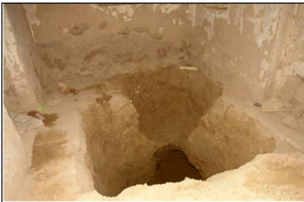
تصویر ۵. تخریب تپه کرکوی به وسیله عوامل انسانی (نگارندگان).